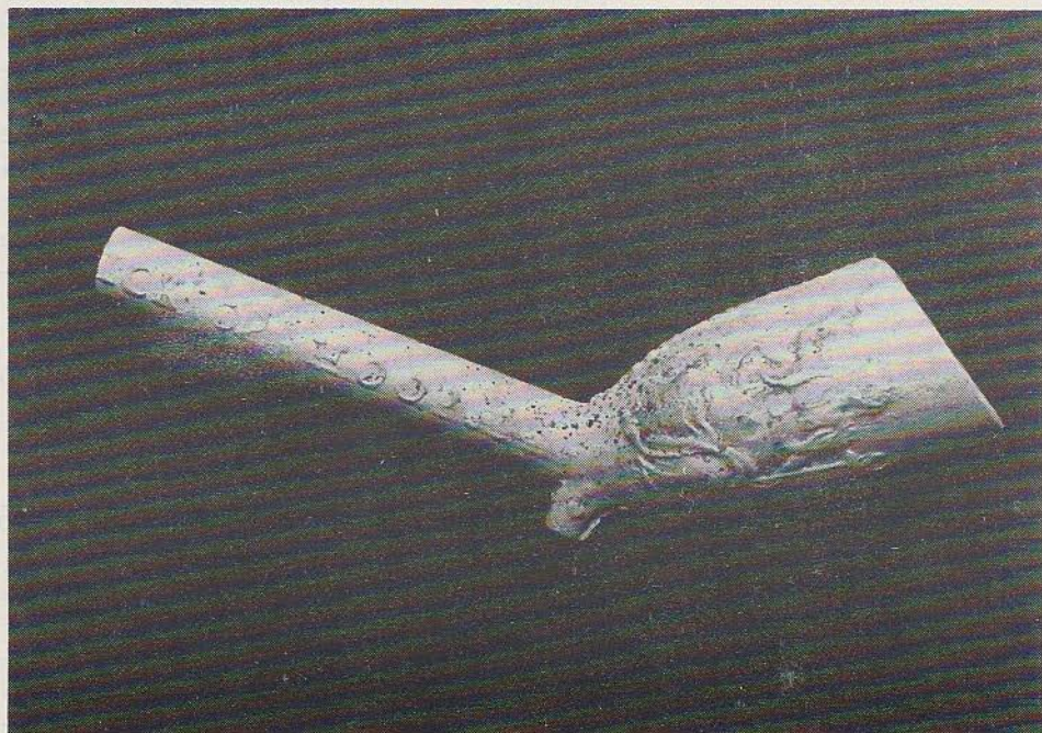
Afb. 3b onder