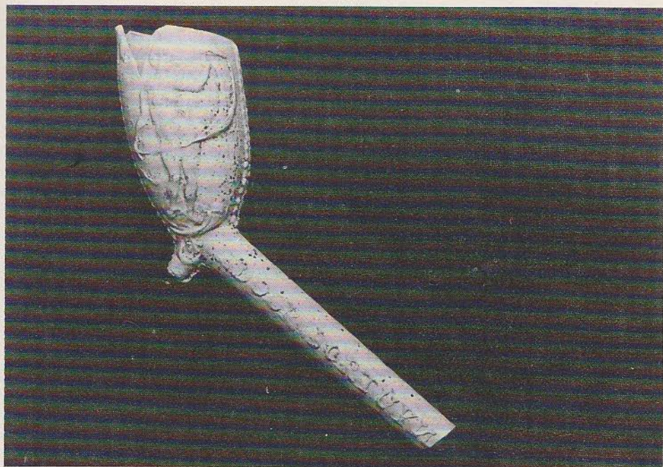
Afb. 3a boven